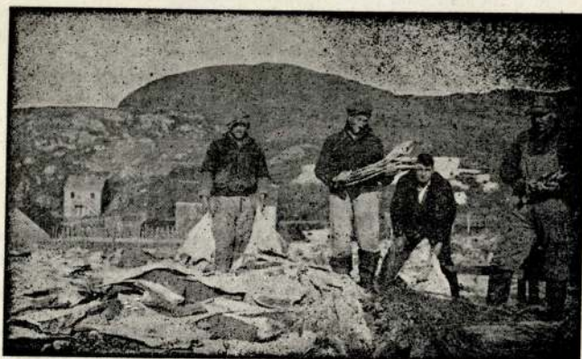
Le séchage de la morue.