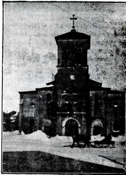
L'église de Saint-Pierre.