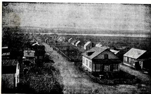
Vue de Miquelon