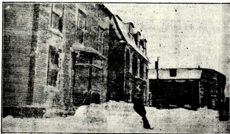
L'hiver à Saint-Pierre