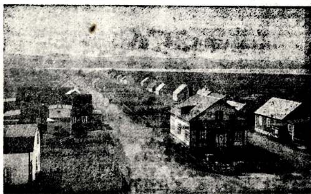
Vue de Miquelon