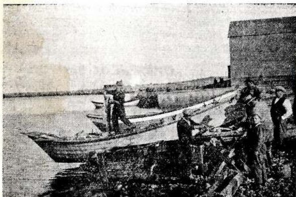
Un doris vient de rentrer.