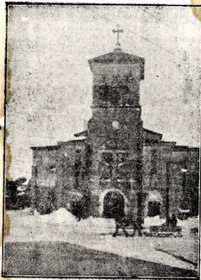
L'église de Saint-Pierre

Dépôt légal p. le Gérant A. Girard 3 mars 1941