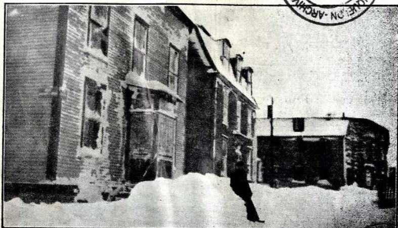
L'hiver à Saint Pierre.