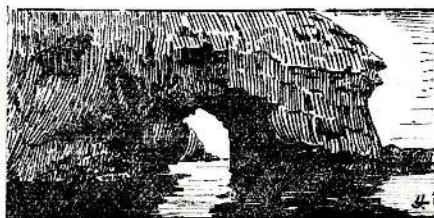
LE CAP PERCÉ DE LANGLADE