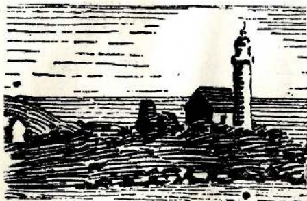
LE FEU ROUGE DE LA PASSE DU SUD-EST