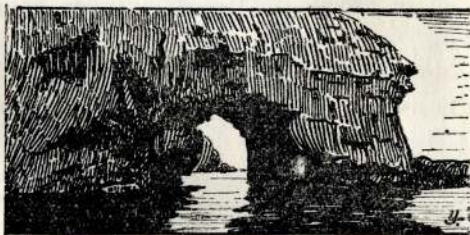
LE CAP PERCÉ DE LANGLADE