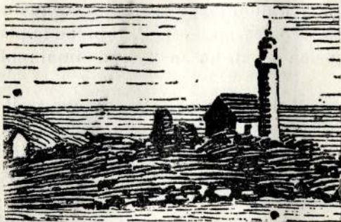
LE FEU ROUGE DE LA PASSE DU SUD-EST