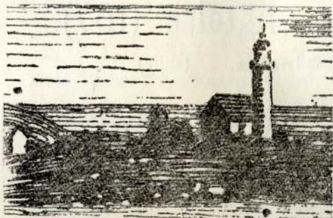
LE FEU ROUGE DE LA PASSE DU SUD-EST