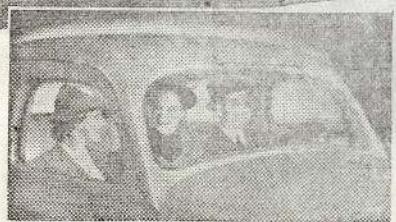
NOTE THE WIDTH • NOTE THE ROOM

Ci-contre le modèle SEDAN DE LUXE. 4 portières six places