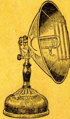
Model No. 480

Le FER À REPASSER « COLEMAN » tient aussi sa bonne place au foyer et donne les meilleurs résultats.