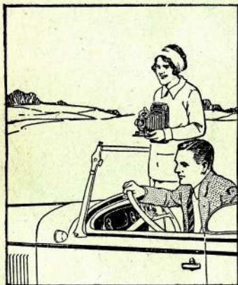
POSTES DE RADIO

DEMANDEZ aussi le plus économique des Cafés décaféinés Le Old Colony