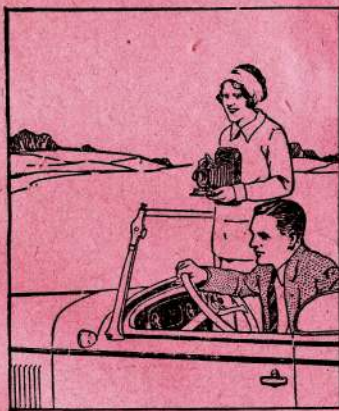
POSTES DE RADIO

DEMANDEZ aussi le plus économique des Cafés décaféinés Le Old Colony